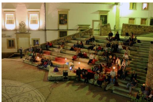
Anfiteatro Museu Cargaleiro – Ciclo Cinema ao Ar - Livre

O “Livro Escalos de Baixo, Meu Berço” é um olhar muito expressivo e emotivo sobre uma vida, uma cultura popular... É um despertar de histórias - e da história - que não queremos nem podemos perder.