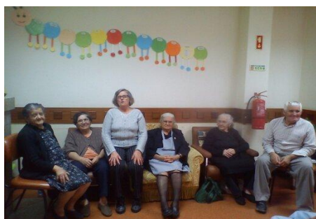
Utentes do Centro de Dia das Benquerenças