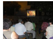
Ladoeiro – Ciclo de Cinema ao Ar Livre

Com esta actividade a Associação EcoGerminar pretendeu utilizar o cinema como um instrumento útil para a educação da sociedade e para a preservação de valores culturais apelando de igual forma á solidariedade das pessoas.