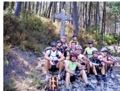
Agosto de 2010 junto à Cruz dos Franceses, na Serra da Labruja (Ponte de Lima) - Caminho Português de Santiago de Compostela.